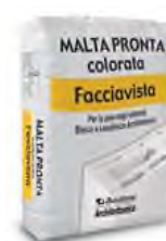
Malta Pronta Facciavista (M5)