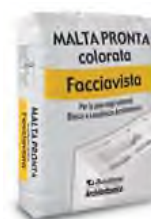
Malta Pronta Facciavista (M5)