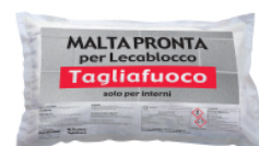
Malta Pronta per Lecablocco Tagliafuoco (M5)